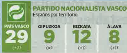
Evolución del voto en el País Vasco Elecciones autonómicas